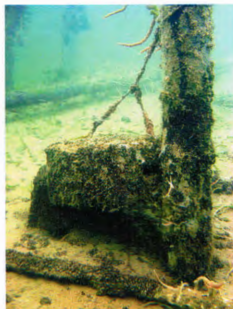
Abb. 235 Am unteren Ende mancher „Kastenpfähle“ sind, offenbar zur Erleichterung beim Einrammen der Pfähle und zum Ausgleich des Auftriebs, Steine befestigt.